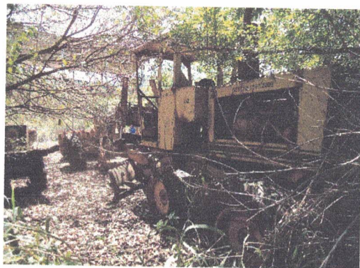
MOTONIVELADORA UBER WABCO