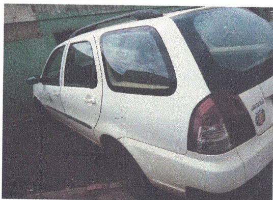
Fiat Palio ANO: 2005 MODELO: WEEKEND ELX RENAVAL:8543400092 PLACA: DJE0385 VEÍCULO EM USO, NECESSITANDO REVISÃO GERAL