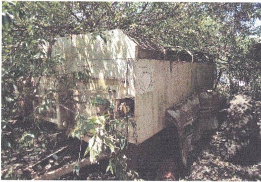
CARRETA DE LIXO – FERRO VELHO