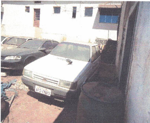
FIAT UNO ANO: 1994/95 MODELO: ELETRONIC RENAVAL: 00629187622 PLACA: AFD0883 VEÍCULO SEM USO NECESSITANDO PEÇAS E MANUTENÇÃO GERAL