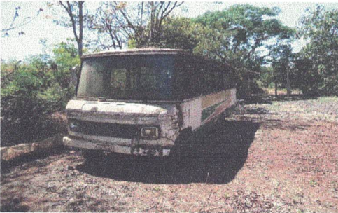
ONIBUS M. BENS ANO: 1980/81 MODELO: 608 RENA VAN: 00518237168 PLACA: ACF 5440 VEÍCULO PARADO NECESSITANDO DE MANUTENÇÃO GERAL