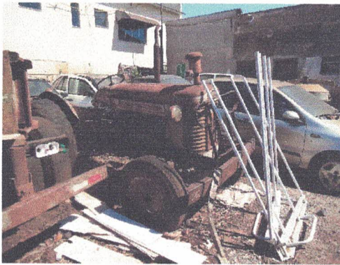
TRATOR MASSEY FERGUSON ANO: MODELO: 50 X IMPLEMENTO NECESSITANDO DE PEÇAS, REPAROS E REFORMA GERAL.