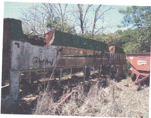
CARCAÇA ONIBUS – FERRO VELHO