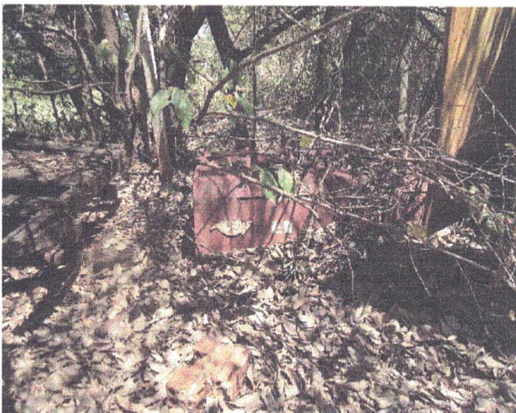
TRATOR MASSEY FERGUSON ANO: MODELO: 292-4

COMPOSTO COM CONCHA HIDRAULICA, NECESSITANDO DE PEÇAS, REPAROS E MANUTENÇÃO GERAL.