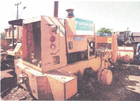
PÁ CARREGADEIRA FIAT ALLIS ANO: MODELO: FR120-2 DESMONTADA, NECESSITANDO PEÇAS E MAUTENÇÃO