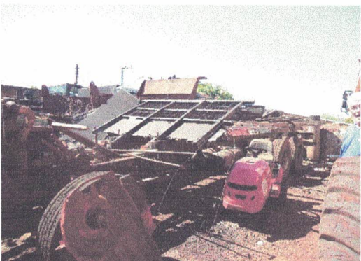
MINI TRATOR ROÇADEIRA MARCA: SNAPER, SEM USO NECESSITANDO DE MANUTENÇÃO GERAL

COMPOSTO COM CONCHA HIDRAULICA, NECESSITANDO DE PEÇAS, REPAROS E MANUTENÇÃO GERAL.