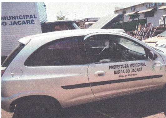
CHEVROLET CELTA ANO: 2004 MODELO: 3 PORTAS RENAVAL: 824758790 PLACA: ALQ 5391 VEICULO EM USO, NECESSITANDO DE MANUTENÇÃO GERAL