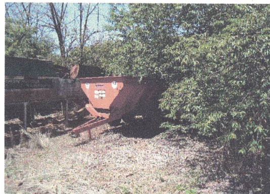
DISTRIBUIDOR DE CALCAREO ANO: 2010 MODELO: DSE 7500

IMPLEMENTO NECESSITANDO DE MANUTENÇÃO GERAL